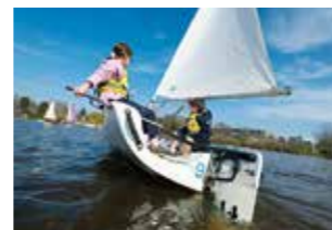
> Club nautique