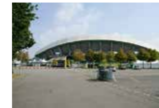
> Stade de la Beaujoire