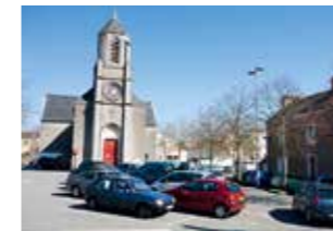
> Bourg de Saint Joseph de Porterie