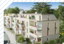
JARDIN CAPUCINE Saint Sébastien sur Loire