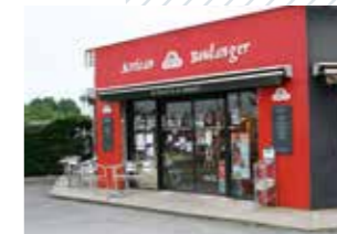
> Commerces de proximité