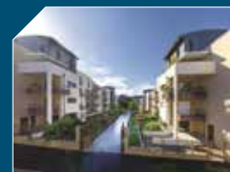
PASSAGE ST CHRISTOPHE Nantes