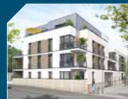
RUSSEIL 1854 Nantes