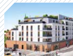
ESPLANADE STE-THERÈSE Nantes