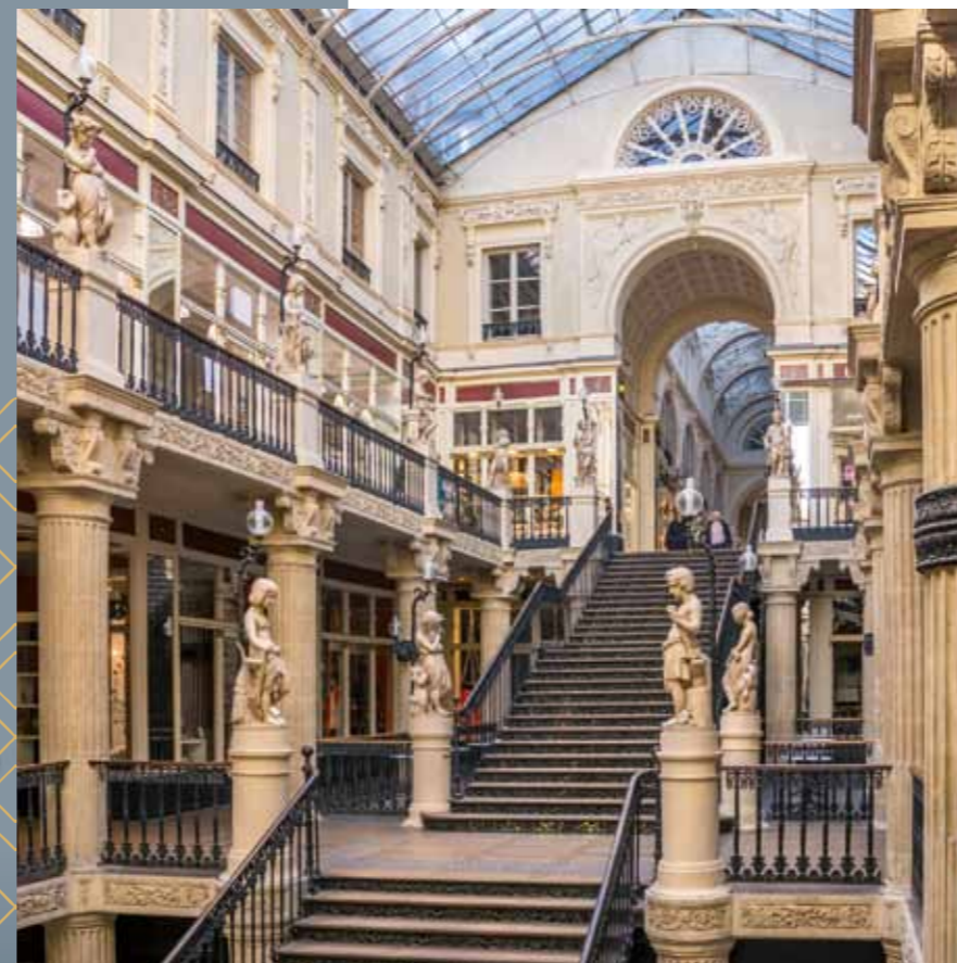
Le Passage Pommeraye, chef-d'œuvre de l'architecture classé monument historique.