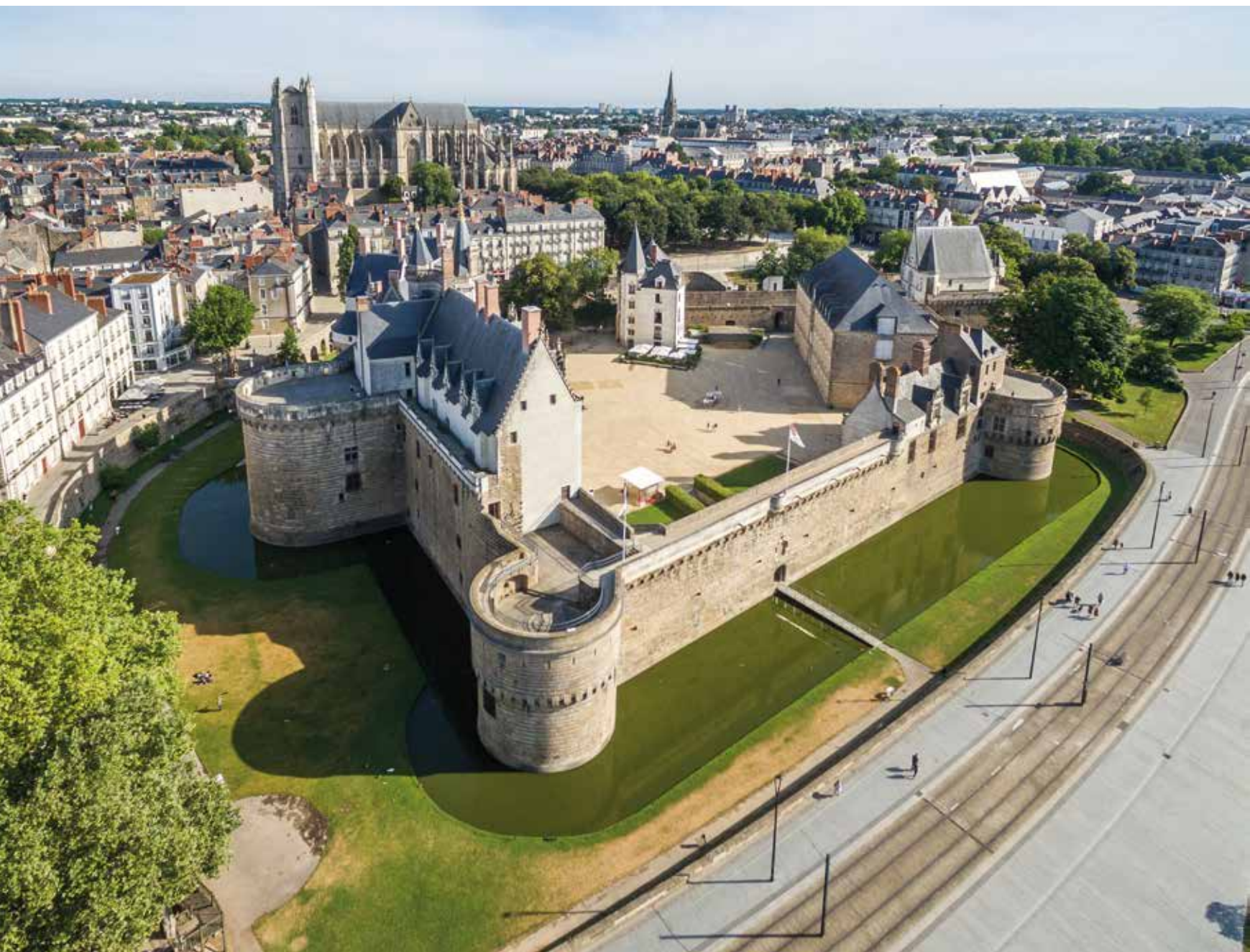
^ LE CHÂTEAU DES DUCS DE BRETAGNE